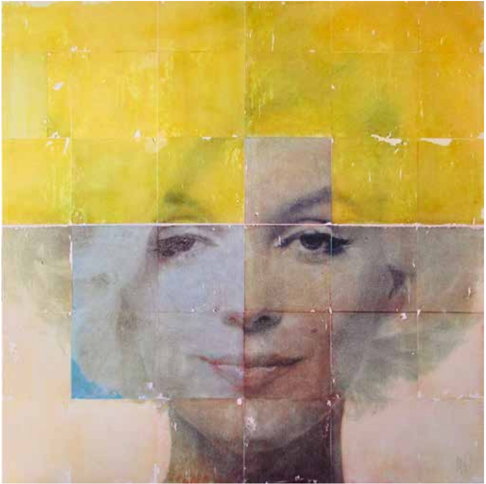
Compositions in Yellow and Blue 1 120 x 120 cm, 2018 Collage transfer sur toile. Papier, encre, pastels